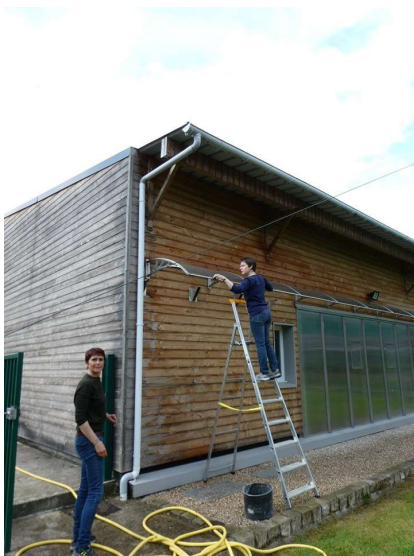
Nettoyage de l'avant-toit