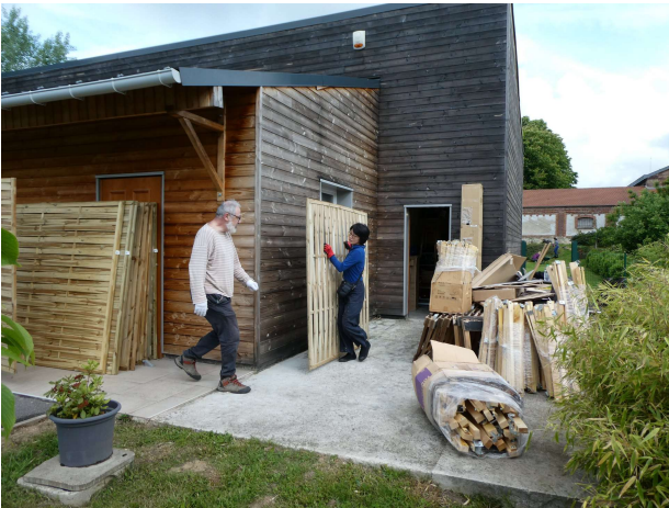
Inventaire et rangement de la réserve

Les 18 et 19 mai derniers, une vingtaine de bénévoles a pris soin du Kyudojo : grand nettoyage intérieur et extérieur, rangement et tri du matériel, entretien des espaces verts, reprofilage de l'azushi... Ces grandes manœuvres – qui sont aussi un moment de convivialité - permettront d'offrir à tous les utilisateurs un espace agréable, fonctionnel et beau !